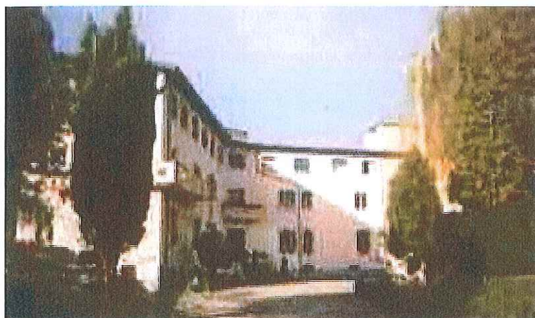
ex casa riposo Gandini

Un Fondo immobiliare (di circa 90 milioni) per la costruzione della nuova scuola media di Peschiera del Garda, ma soprattutto finalizzato alla trasformazione alberghiera, commerciale, residenziale e a servizi dei tre edifici militari asburgici (l'ex Padiglione ufficiali e le ex caserme "XXX Maggio" e "La Rocca"). E' la proposta formalizzata il primo agosto 2016 al Comune da "Serenissima Sgr", finanziaria con sede a Verona e posseduta da operatori finanziari, industriali, banche e assicurazioni. (vedi box in fondo).